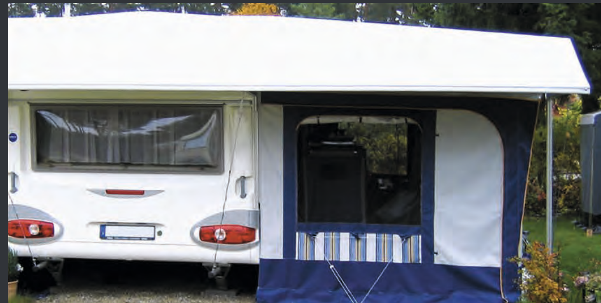
1 Alu-Spezial-Profile mit 2 durchgehendem Unterzug aus Alu-Spezial-Profil 65/40 mm 3 Stützen aus Alu-Spezial-Profil 65/40 mm, im Boden verankert, auch für Schneelasten geeignet.